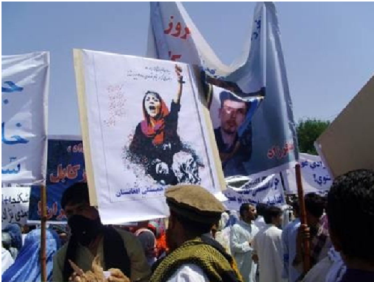
نظارات مردم در افغانستان در همبستگی با مردم ایران