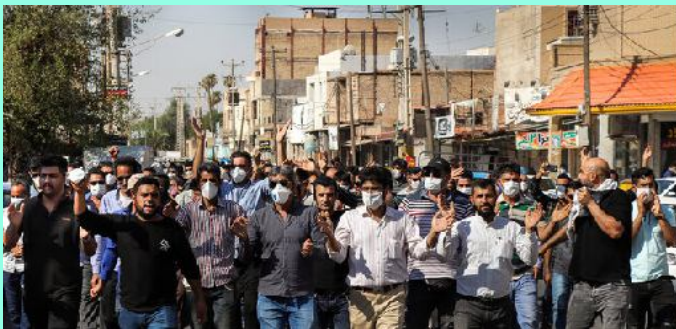
حزب کمونیست کارگری ایران