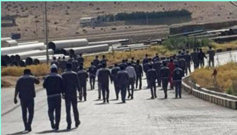
حزب کمونیست کارگری ایران