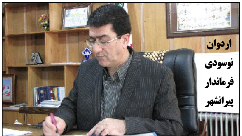
اردوان نوسودی فرماندار پیرانشهر