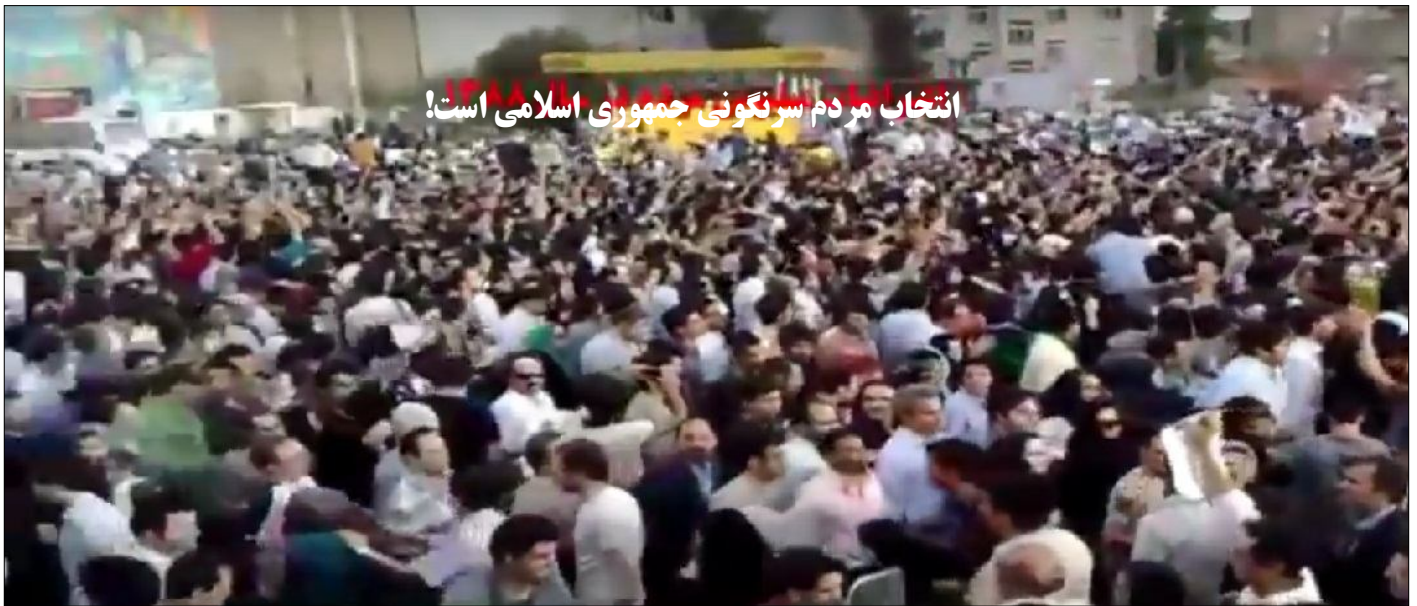
انتخاب مردم سرنگونی جمهوری اسلامی است!

بیش از ۳۰۰ نفر مردم سوریه در اثر بمباران شیمیایی رژیم اسد کشته و زخمی شدند محمد آسنگران صفحه ۳