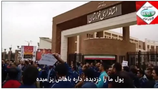
پول ما را دزدیده، داره باهاش یز میده

پرداخت یکجا و کامل حقوق ماههای آذر، دی و بهمن، تعیین تکلیف چگونگی پرداخت حقوق اسفند و عیدی و پاداش، پرداخت حق بیمه تامین اجتماعی، برقراری بیمه تکمیلی پرسنل و ساماندهی و برقراری مجدد سرویسهای ایاب و ذهاب است.