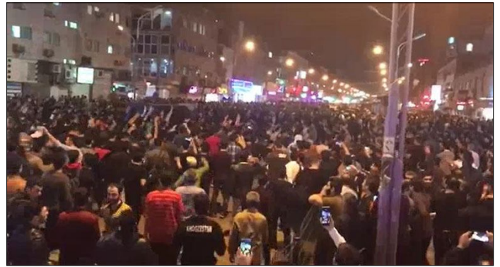
ثروت اندوزی يك اقلیت سرمایه دار.

روند انقلابی ای که با خیزش دیماه ۹۶ آغاز شد میروند تا طومار حکومت اسلامی را در هم پیچند. در این شرایط داشتن تصویر روشنی از سرنگونی نظام جمهوری اسلامی و خصوصیات نظامی که باید جایگزین آن شود برای پیشروی و پیروزی انقلاب مطلقاً ضروری است. اکثریت قریب به اتفاق مردم ایران خواهان حکومت و جامعه ای مدرن، متمدن، انسانی و بری از هر گونه تبعیض و نابرابری از جمله تبعیضات مذهبی و قومی و ملی و جنسیتی و طبقاتی هستند. تنها نظامی می‌تواند رفاه و آزادی و برابری را برای همگان تضمین کند که مرکز و محور ارزشها و سیاستها و قوانین اش انسان و انسانیت و ارزشهای جهانشمول انسانی باشد و نه اسلامیسیم و ناسیونالیسم و ایرانیگری و تابوها و مقدسات و تعصبات مذهبی- قومی- ملی- میهنی.