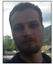
سامران کاکه ر ش

شامگاه ۲۷ مرداد نیروهای هنگ مرزی، حفاظت سردشت و پاسگاه کپران بیش از ۳۰ کولبر را دستگیر کرده و به پاسگاه روستای بیتوش انتقال می دهند. مسئولین این پاسگاهها به ویژه پاسگاه کپران دست به آزار و شکنجه کولبران زده و اموال همراهشان را ضبط می کنند.