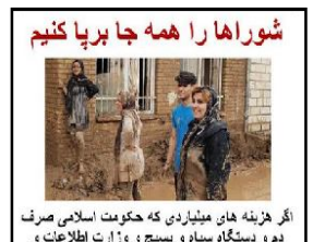
شوراهارا همه جا برپا کنیم

زنده باد همبستگی مردم برآی کمک رسانی به سیل زدهگان! سرنگون باد جمهوری اسلامی!