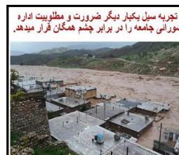
تجربه سیل یکبار دیگر ضرورت و مطلوبیت اداره شورایی جامعه را در برابر چشم همگان قرار میدهد.